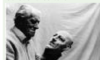
Opere dello scultore genovese Lorenzo Garaventa